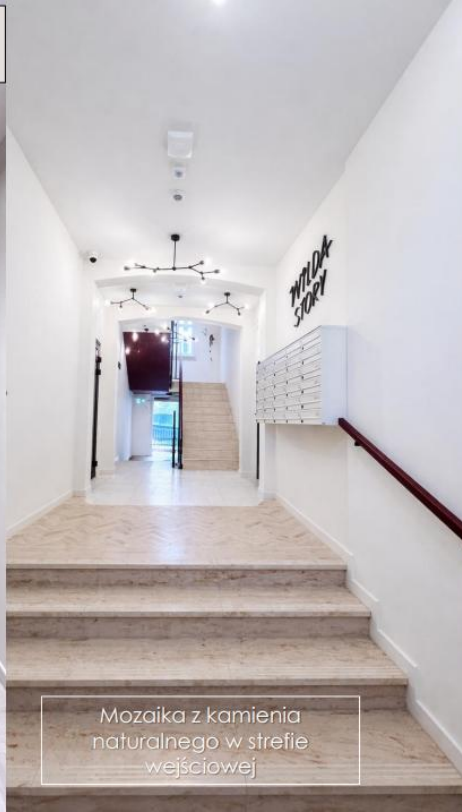
Mozaika z kamienia naturalnego w strefie wejściowej