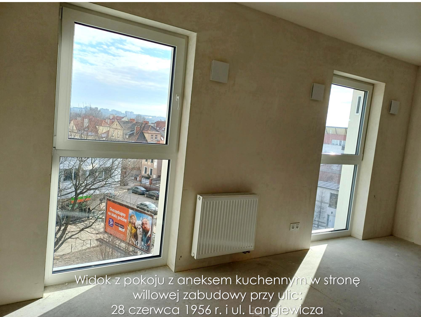
Widok z pokoju z aneksem kuchennym w stronę willowej zabudowy przy ulic: 28 czerwca 1956 r. i ul. Langjewicza