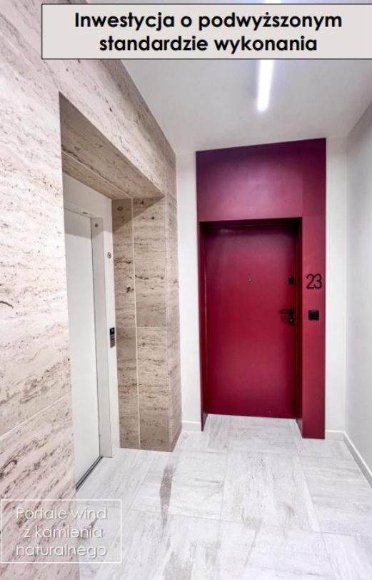
Portale wind z kamienia naturalnego